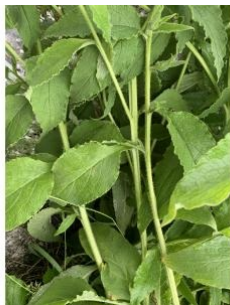
à inconnu observée le 3 juillet 2020 par Liliane Roubaudi

Réseau Tela botanica, Programme Flora Data, version dynamique.