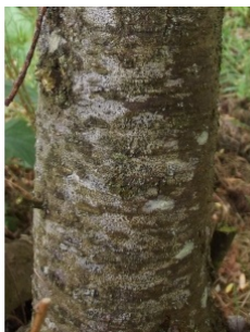
à inconnu observée le 24 avril 2014 par jceh

Réseau Tela botanica, Programme Flora Data, version dynamique.