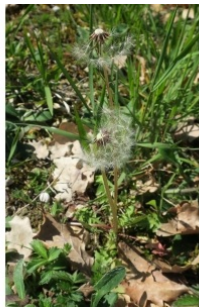
à inconnu observée le 4 avril 2019 par Emilien Henry

Réseau Tela botanica, Programme Flora Data, version dynamique.