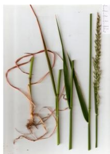
à inconnu observée le 14 mai 2015 par Florent Beck

Réseau Tela botanica, Programme Flora Data, version dynamique.