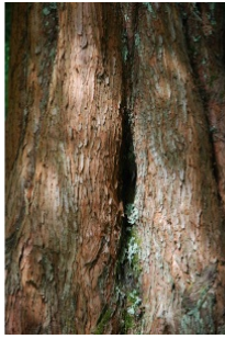
à inconnu observée le 3 septembre 2010 par Ioic Ruellan

Réseau Tela botanica, Programme Flora Data, version dynamique.