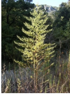
à inconnu observée le 21 septembre 2008 par Sylvain Piry

Réseau Tela botanica, Programme Flora Data, version dynamique.