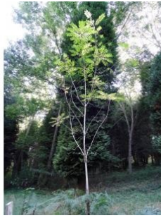
à inconnu observée le 30 septembre 2016 par Alain Bigou

Réseau Tela botanica, Programme Flora Data, version dynamique.