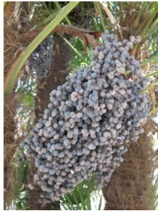
à inconnu observée le 25 mai 2011 par Marie Portas

Réseau Tela botanica, Programme Flora Data, version dynamique.