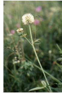
à inconnu observée le 10 juillet 2000 par Liliane Roubaudi

Réseau Tela botanica, Programme Flora Data, version dynamique.