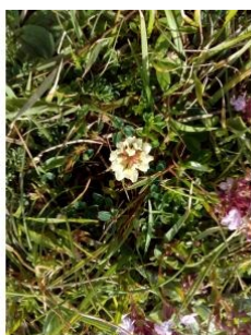
à inconnu observée le 15 juin 2016 par Florent Beck

Réseau Tela botanica, Programme Flora Data, version dynamique.