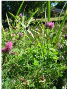
à inconnu observée le 4 juillet 2011 par David Mercier

Réseau Tela botanica, Programme Flora Data, version dynamique.