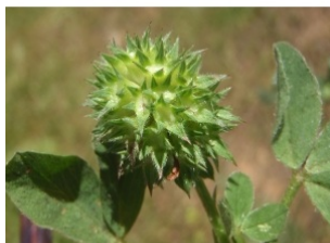
à inconnu observée le 25 avril 2016 par Genevieve Botti

Réseau Tela botanica, Programme Flora Data, version dynamique.