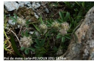
Pré de mme carle-PELVOUX (05) 1874m

Réseau Tela botanica, Programme Flora Data, version dynamique.