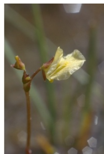
à inconnu observée le 28 juin 2009 par HERVE Bellat

Réseau Tela botanica, Programme Flora Data, version dynamique.