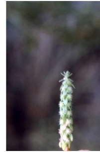
à inconnu observée le 9 mai 1998 par Liliane Roubaudi

Réseau Tela botanica, Programme Flora Data, version dynamique.