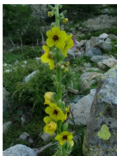
à inconnu observée le 3 juillet 2010 par allemand.denis@...

Réseau Tela botanica, Programme Flora Data, version dynamique.