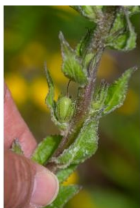
à inconnu observée le 28 mai 2019 par Jean-Jacques Houdré

Réseau Tela botanica, Programme Flora Data, version dynamique.