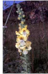
à inconnu observée le 19 avril 2004 par Liliane Roubaudi

Réseau Tela botanica, Programme Flora Data, version dynamique.