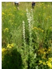
à inconnu observée le 11 juillet 2013 par Emmanuel Stratmain

Réseau Tela botanica, Programme Flora Data, version dynamique.