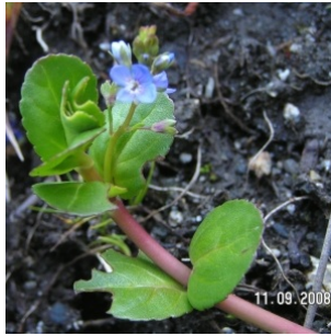
à inconnu observée le 11 septembre 2008 par Alain Bigou

Réseau Tela botanica, Programme Flora Data, version dynamique.