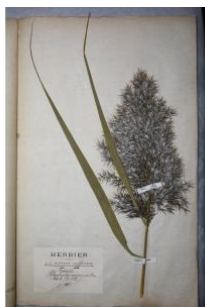
à inconnu observée le 1 septembre 1883 par Herbier Guittot

Réseau Tela botanica, Programme Flora Data, version dynamique.