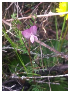
à inconnu observée le 2 avril 2014 par Nicolas Suberbielle

Réseau Tela botanica, Programme Flora Data, version dynamique.