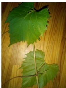
à inconnu observée le 26 juin 2018 par Vitalain

Réseau Tela botanica, Programme Flora Data, version dynamique.