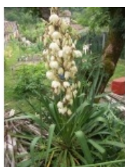
à inconnu observée le inconnue par Mathieu Sinet

Réseau Tela botanica, Programme Flora Data, version dynamique.