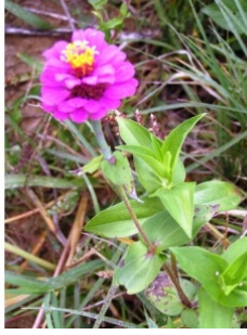
à inconnu observée le 27 septembre 2005 par Alain Bigou

Réseau Tela botanica, Programme Flora Data, version dynamique.