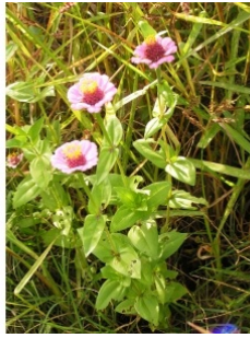
à inconnu observée le 27 septembre 2005 par Alain Bigou

Réseau Tela botanica, Programme Flora Data, version dynamique.