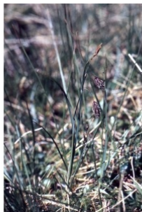
à inconnu observée le 19 juin 2000 par Liliane Roubaudi

Réseau Tela botanica, Programme Flora Data, version dynamique.