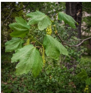
à inconnu observée le 20 mai 2014 par Denis Nespoulous

Réseau Tela botanica, Programme Flora Data, version dynamique.