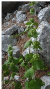
à inconnu observée le 24 mai 2014 par Ans Gorter

Réseau Tela botanica, Programme Flora Data, version dynamique.