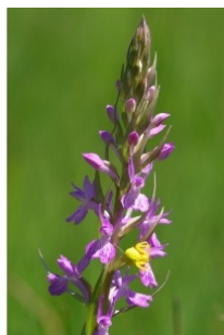
à inconnu observée le 28 mai 2010 par Fabien Kendall

Réseau Tela botanica, Programme Flora Data, version dynamique.