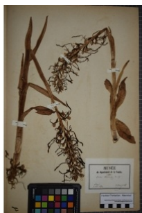
à inconnu observée le 1 juillet 1874 par Herbier Pontarlier-marichal

Réseau Tela botanica, Programme Flora Data, version dynamique.