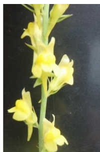
à inconnu observée le 3 juin 2014 par Genevieve Botti

Réseau Tela botanica, Programme Flora Data, version dynamique.