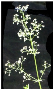
à inconnu observée le 18 août 2015 par Liliane Roubaudi

Réseau Tela botanica, Programme Flora Data, version dynamique.