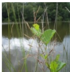
à inconnu observée le 20 juillet 2012 par David Mercier

Réseau Tela botanica, Programme Flora Data, version dynamique.