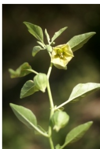
à inconnu observée le 15 septembre 2011 par Liliane Roubaudi

Réseau Tela botanica, Programme Flora Data, version dynamique.