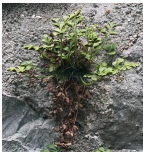
à inconnu observée le 19 juin 2019 par Rémi Julliard

Réseau Tela botanica, Programme Flora Data, version dynamique.