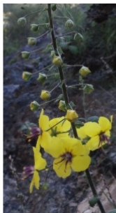
à inconnu observée le 24 avril 2014 par Liliane Roubaudi

Réseau Tela botanica, Programme Flora Data, version dynamique.