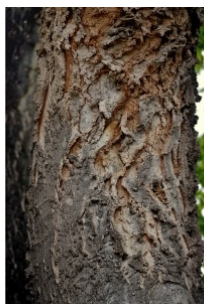
à inconnu observée le 30 avril 2016 par Marc Chouillou

Réseau Tela botanica, Programme Flora Data, version dynamique.