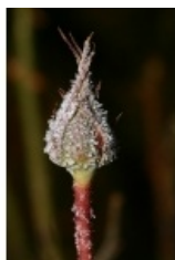
à inconnu observée le 28 décembre 2005 par Philippe Burnel

Réseau Tela botanica, Programme Flora Data, version dynamique.