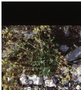
à inconnu observée le 6 juillet 1999 par Liliane Roubaudi

Réseau Tela botanica, Programme Flora Data, version dynamique.