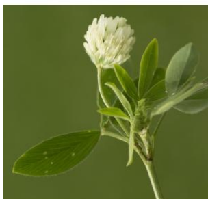
à inconnu observée le 18 juin 2016 par Jean-Jacques Houdré

Réseau Tela botanica, Programme Flora Data, version dynamique.