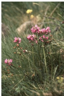
à inconnu observée le 2 juillet 2004 par Liliane Roubaudi

Réseau Tela botanica, Programme Flora Data, version dynamique.