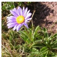
à inconnu observée le 26 juillet 2006 par Alain Bigou

Réseau Tela botanica, Programme Flora Data, version dynamique.