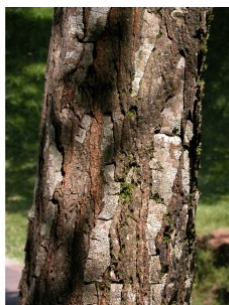
à inconnu observée le 9 juin 2005 par ann2005

Réseau Tela botanica, Programme Flora Data, version dynamique.