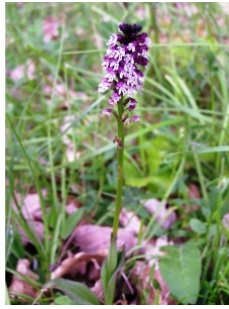
à inconnu observée le 14 mai 2005 par Alain Bigou

Réseau Tela botanica, Programme Flora Data, version dynamique.