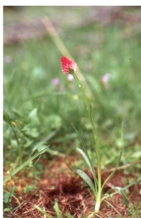
à inconnu observée le 2 juillet 1994 par Liliane Roubaudi

Réseau Tela botanica, Programme Flora Data, version dynamique.