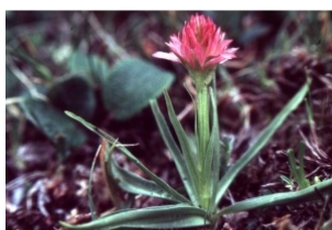
à inconnu observée le 2 juillet 1994 par Liliane Roubaudi

Réseau Tela botanica, Programme Flora Data, version dynamique.