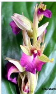
à inconnu observée le 18 avril 2014 par Michel Alborghetti

Réseau Tela botanica, Programme Flora Data, version dynamique.