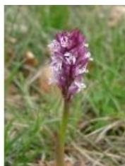
à inconnu observée le 27 avril 2012 par Paul Fabre

Réseau Tela botanica, Programme Flora Data, version dynamique.