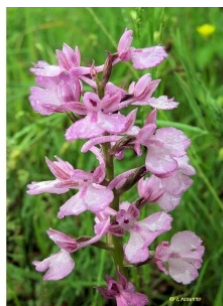
à inconnu observée le 16 mai 2008 par liliane Pessotto

Réseau Tela botanica, Programme Flora Data, version dynamique.