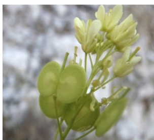
à inconnu observée le 17 avril 2014 par Genevieve Botti

Réseau Tela botanica, Programme Flora Data, version dynamique.