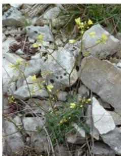
à inconnu observée le 5 avril 2014 par tom13

Réseau Tela botanica, Programme Flora Data, version dynamique.